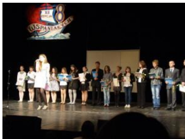
Gala Konkursu Ośmiu Wspaniałych