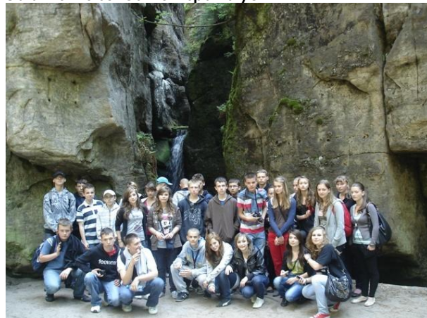
Wycieczka szkolna do Kotliny Kłodzkiej