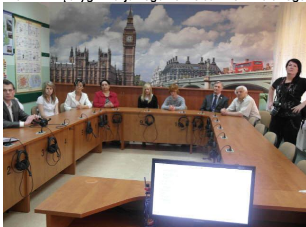
Otwarcie Laboratorium Językowego