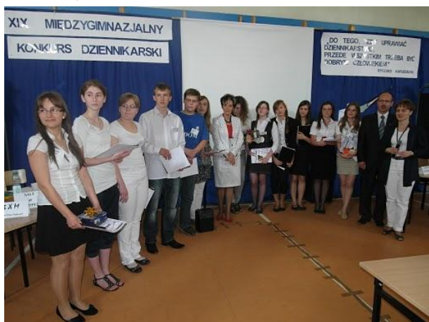
Final XIX Międzyszkolnego Konkursu Dziennikarskiego